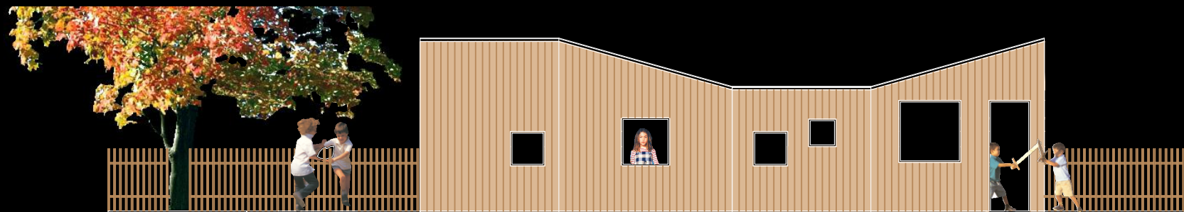
cabaña en los árboles. Desarrollo