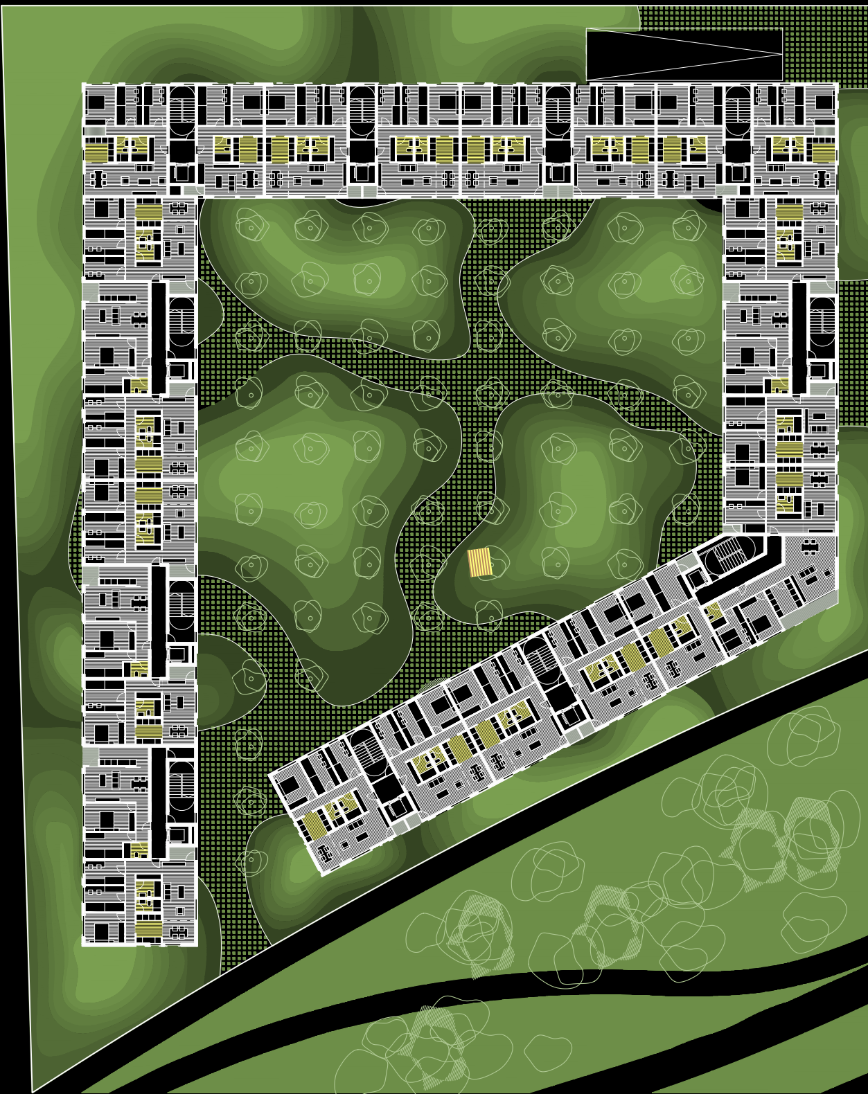
planta tipo 1/500